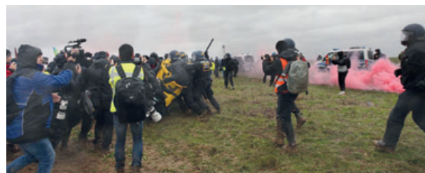
Lützerath-Räumung im Januar 2023