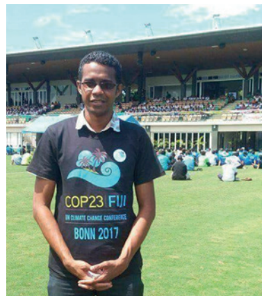
Lagi Seru, Fidschi